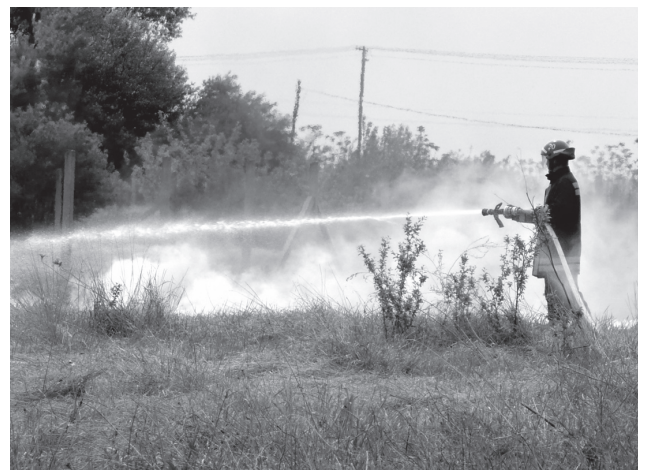
◆ A tiszánánai önkéntesek oltották el a hirtelen lobbant tüzet

A tavalyi csapadékos tavasszal ellentétben az idén szárazság jellemzi időjárásunkat. A tűzgyújtás ezért különösen veszélyes, főként szeles időben. Biztonságunk érdekében fokozott óvatosságot és körültekintést kérünk a lakosságtól!